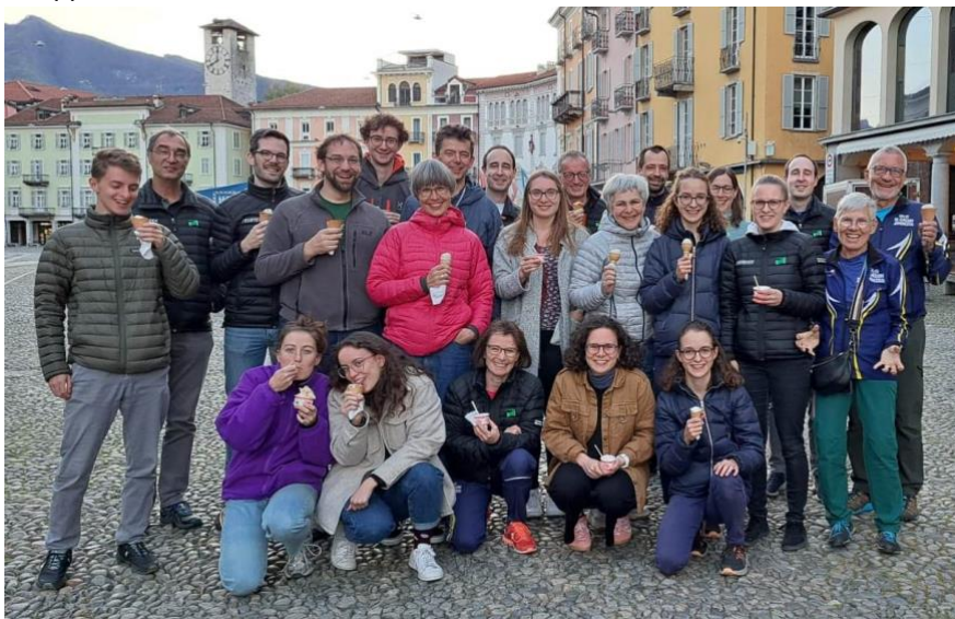
Die Eisdiele in Locarno freute sich über das kollektive Eis-Essen der OLG.

Eisdiele, bedrängte dann noch Passanten, um den Ausflug fotodokumentatorisch festzuhalten, bevor eine kleine Splittergruppe noch dem Ruf einer Tessiner Rockband folgte und das Nachtleben von Locarno genoss. Das Rahmenprogramm liess damit auch kaum Wünsche offen und rundeten das Wochenende gekonnt ab.