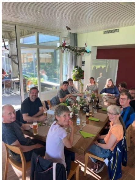
Die Mitglieder der OLG beim gemeinsamen Nachtessen am Fachsimpeln.