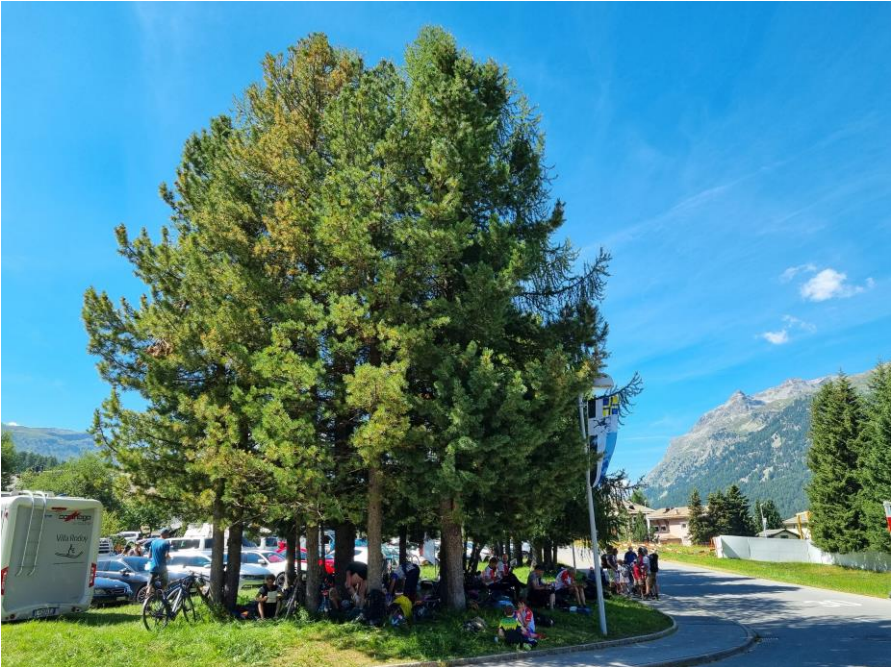
Die Umkleide fiel vergleichsweise spartanisch aus.

Am zweiten Tag wurde es alpin bei einer Mitteldistanz, das Laufgebiet befand sich bei der Corvatsch Mittelstation. Der Lauf bot viel Abwechslung wie Wiesen, Blockfelder, Bäche mit Sümpfen und Baustellen. Unschön war nur der Rückweg vom Ziel zum WKZ: 200 Höhenmeter aufwärts! Am späten Nachmittag wurde die dritte Etappe als Sprint im Dorf Silvaplana ausgetragen. Der Bahnleger wusste den Ort mit Campingplatzgelände und sogar